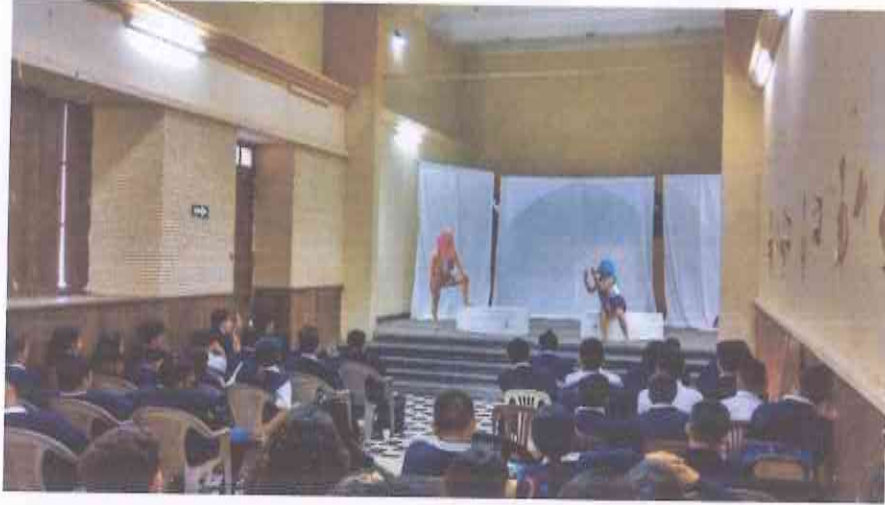
4) Instituto Nacional Experimental de Educación Básica con Orientación Ocupacional PEMEM II. Fecha: jueves 14 de marzo del 2019.